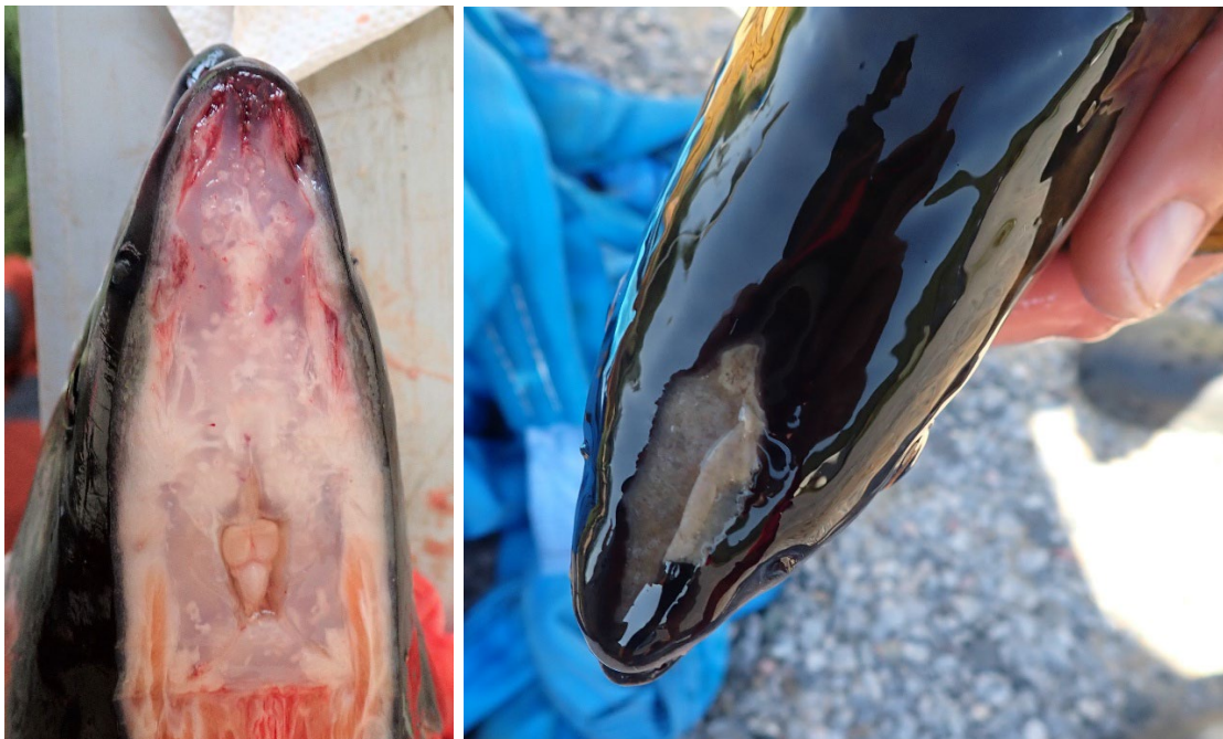
Figur 4 Bildet til venstre viser indre blødninger i snuteregionen hos en pukkellaks med bare mindre ytre tegn på skade. Bildet til høyre viser pukkellaks med sår i snuteregion og skalletak

Vurdering av skadens alvorlighetsgrad er også subjektiv, og både gjennomføring og standardisering av slike vurderinger er utfordrende. En ytterligere usikkerhet er at skadeomfanget ikke nødvendigvis gjenspeiles i det