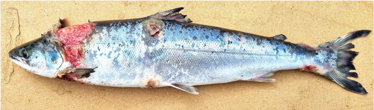
Figur 5. Dødelig skadet atlantisk laks – hvilken kategori skade? Det kan observeres sår, skjelltap, finneskader og soppinfeksjon. Skadene er trolig relatert til garn.

For at resultater skal kunne sammenlignes og evalueres, må det være mulig å beregne prevalensen av skader. Antall skadde fisk bør derfor kunne relateres til totalt antall undersøkte fisk. Enkelttilfeller, som observasjoner av død fisk på sperre, kan være vanskelige å kvantifisere, men er likevel viktige observasjoner.