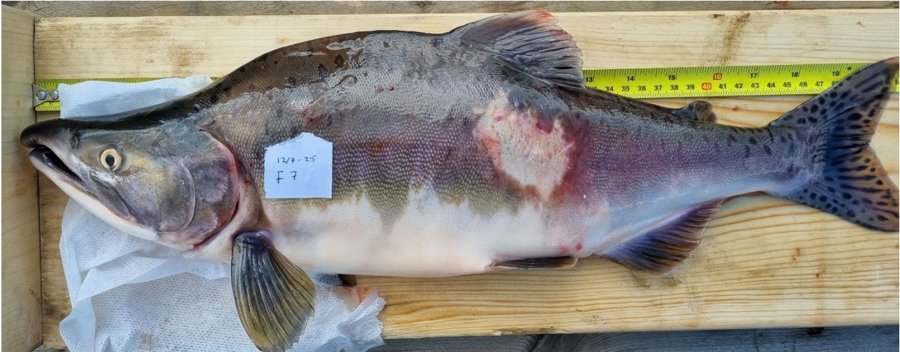
Figur 3. Pukkellaks med grodde skade på siden.

En mindre skade kan være vanskelig å registrere, men dersom den blir kolonisert av for eksempel sopp, vil den være mer synlig. Tidspunktet for observasjon kan derfor være avgjørende for om skaden blir registrert eller ikke. Kameraovervåking av fisk rett etter passering av felle vil trolig observere færre skader enn om registreringen ble gjennomført en uke senere. Tilsvarende kan grodde skader (Figur 3) bli registrert som aktive skader, selv om de har begrenset betydning for fisken og trolig ikke er knyttet til sortering i fellen. Grodde skader ansees i hovedsak ikke som relevante for problemstillinger knyttet til fiskefeller.