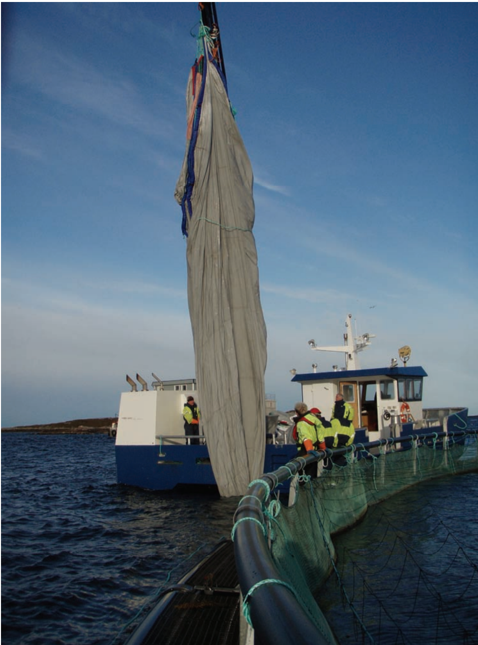
Bilde 1. Utsetting av skjørt i stormerd krever solid utstyr

Resultatene fra spørreundersøkelsen viser at kun tre av 14 lokaliteter hadde en kombinasjon av opplining og lengde på skjørt som gjorde at skjørtet gikk to meter dypere enn nota slik terapi anbefalingen angir. Følgende kombinasjoner er registrert: